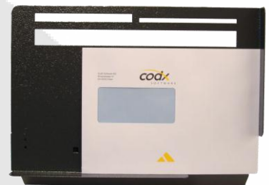
ELFK (Elektronische Format Erkennung)